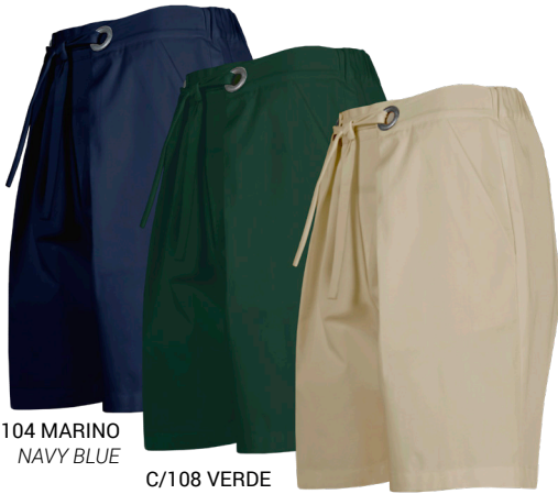
C/104 MARINO NAVY BLUE