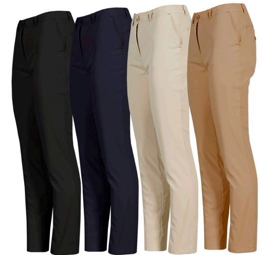
C/001 NEGRO BLACK C/104 MARINO BLUE NAVY C/110 BEIGE C/151 CAMEL

REF. 700028 PANTALÓN CHINO MUJER/CHINO PANT WOMAN SIZES 36-58 SARGA/TWILL 177gr/m 2 100%PES