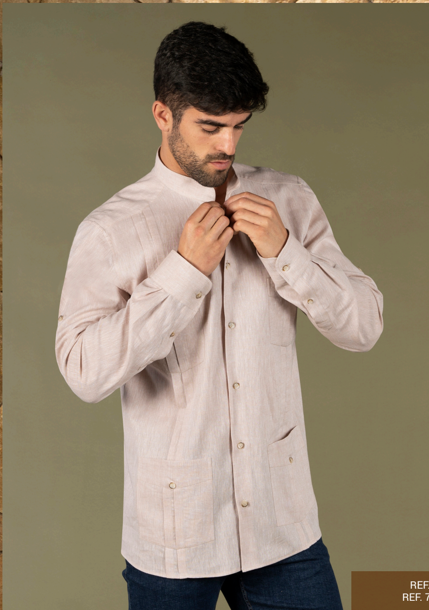
REF. 700027 PANTALÓN CHINO HOMBRE/CHINO PANT MAN (P. 33) REF. 700028 PANTALÓN CHINO MUJER/CHINO PANT WOMAN (P. 33)