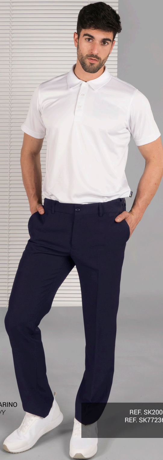
C/104 MARINO BLUE NAVY

REF. SK200051 EC HOMBRE/MAN (P. 9 CAT. SKECHERS) REF. SK77236 EC MUJER/WOMAN (P. 17 CAT. SKECHERS)