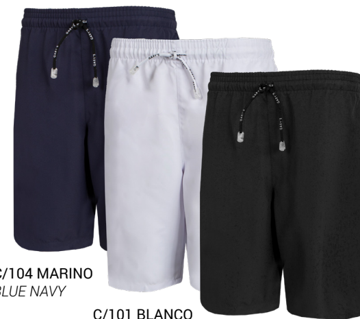
C/104 MARINO BLUE NAVY

REF. 700017 BERMUDA/SHORT SIZES XS-YL UNISEX MICROFIBRA/MICROFIBRE 148gr/m 2 100%PES