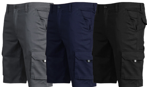
C/109 GRIS GREY