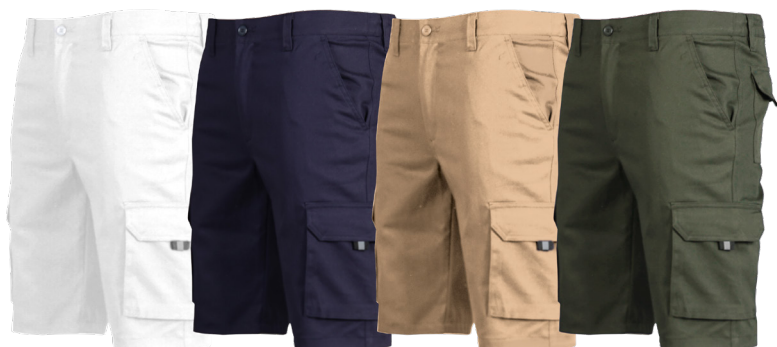
C/101 BLANCO WHITE