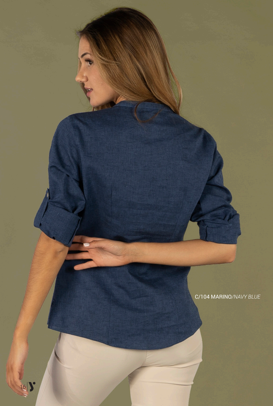
C/104 MARINO/NAVY BLUE