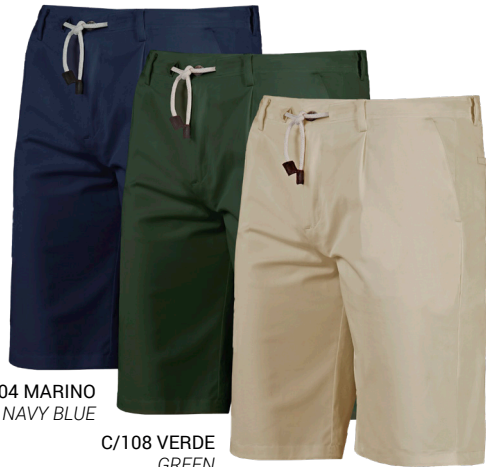
C/104 MARINO NAVY BLUE

The water-repellent fabric has received a treatment that makes the garment avoids moisture and filtrations, so the water won't create a layer on the surface with makes this fabric highly breathable.