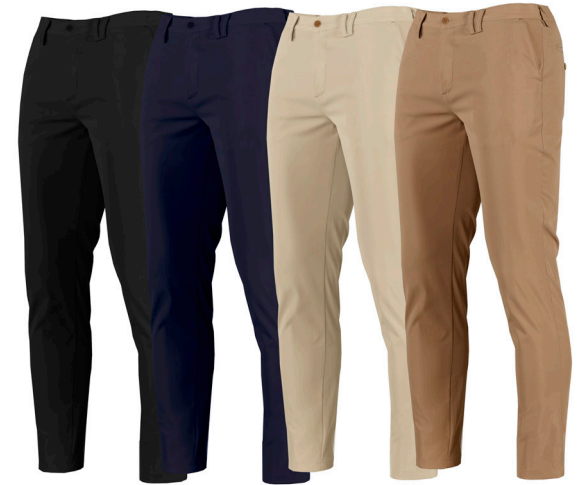
C/001 NEGRO BLACK C/104 MARINO BLUE NAVY C/110 BEIGE C/151 CAMEL

REF. 700027 PANTALÓN CHINO HOMBRE/CHINO PANT MAN SIZES 36-60 SARGA/TWILL 177gr/m 2 100%PES