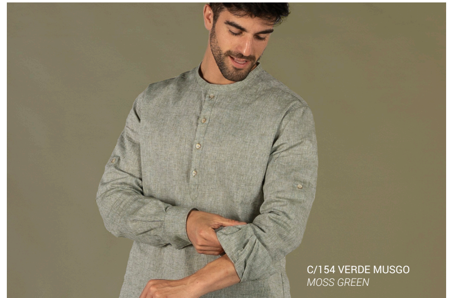
C/154 VERDE MUSGO MOSS GREEN